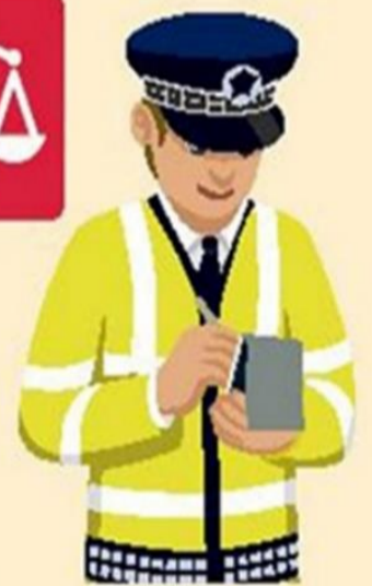
Бүртгэгдсэн гэмт хэргийн тоо