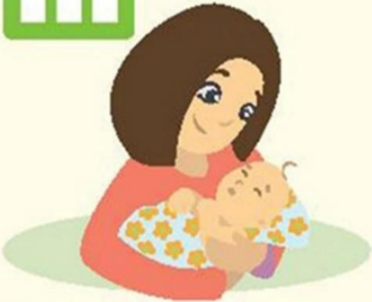
Амаржсан эхийн тоо