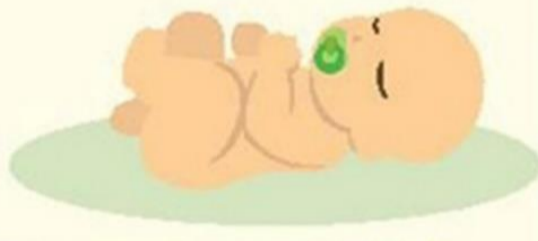
Төрсөн хүүхдийн тоо