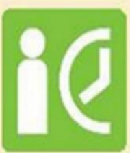
Бүртгэлтэй ажилгүй иргэдийн тоо