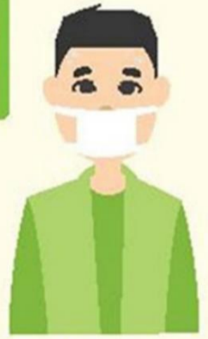
Халдварт өчнөөр өвчилсэн хүний тоо